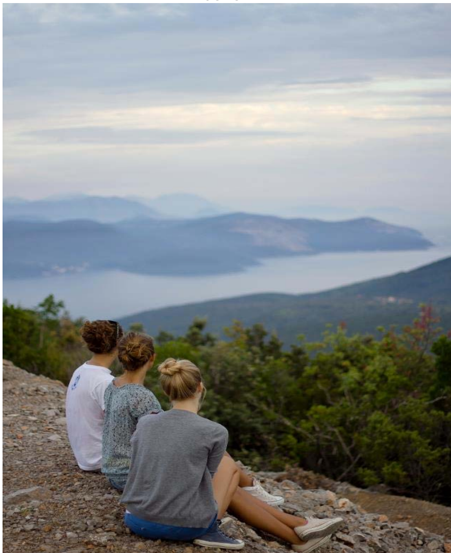
Poslednja stanica, vrh Obosnika i pogled u beskraj...