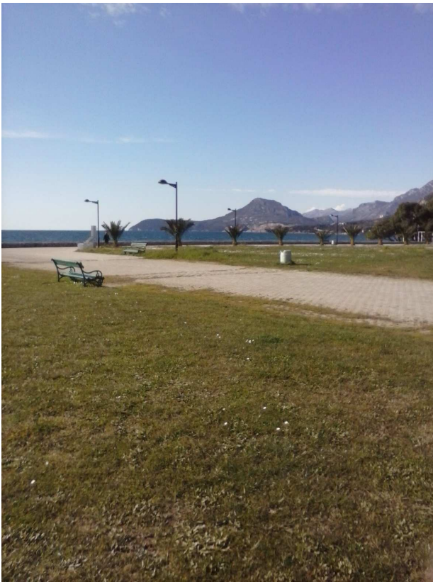
Dio šetališta pored mora koje je jedno od najljepših na Crnogorskom primorju.