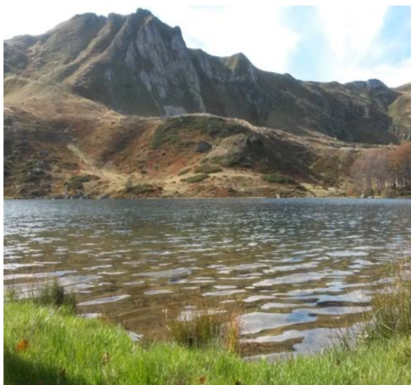
Ne, nije aritmija, to i vama staje dah!