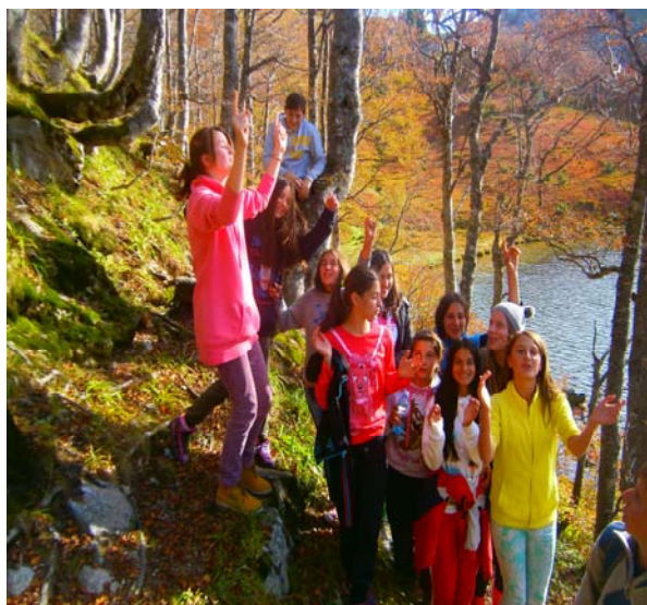
Čak i na ovaj način ponijeli smo uspomene sa sobom.