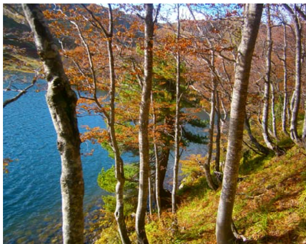
Prirodu smo ostavili netaknutom, nadamo se da ćete i vi tako, ako vas je naša foto priča zaintrigirala da posjetite ljepše lice Berana.