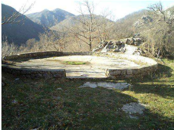
Lokacija Bar – Rumija . selo Međureč