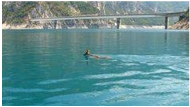
Srna pliva preko Pivskog jezera