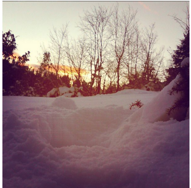
Pratili su moje tragove.