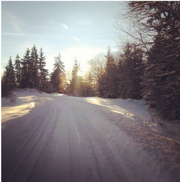
Pratili me gdje god da krenem,