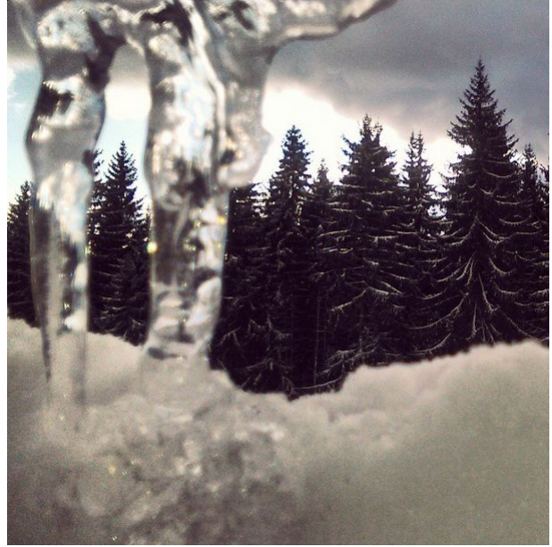
Sjajili medju ledenicama