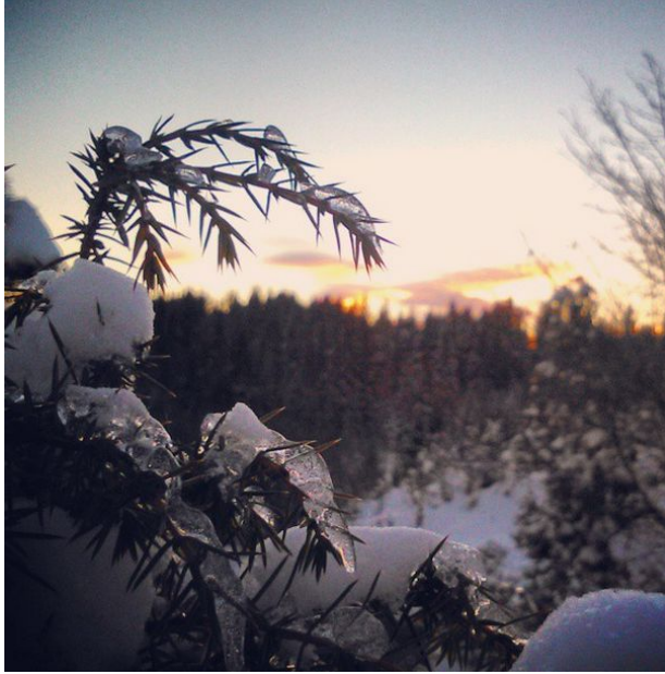
Budili me svojom toplinom