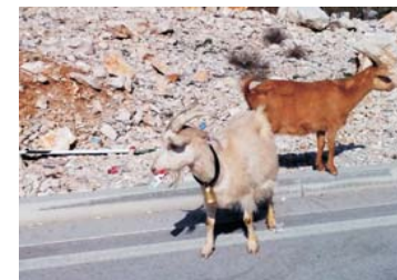
"Jarcu se sviđelo" - Andrija Babović (1 mjesto)

Originalne fotografije treba dostaviti odvojeno, prateći uputstva za njihovu izradu u nastavku. Dozvoljeno je do tri fotografije, sa komentarima ispod fotografije sa maksimalno 20 riječi u svakom.